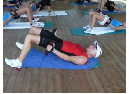
Hier die erste Stunde XCO Shape...