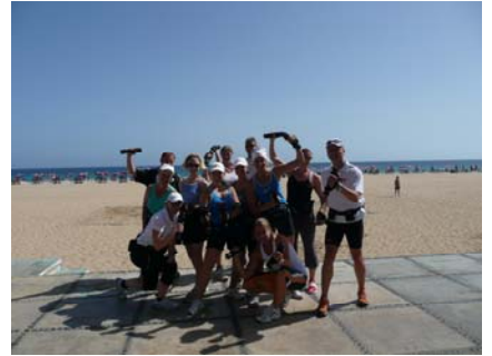
...und danach die erste Einheit XCO Walking.

Drei Tage später, mit vielen neu gewonnen Eindrücken und schönen Momenten, ging es weiter zum nächsten Club Esquinzo Playa.